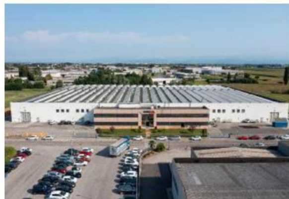
Eurocoil Lo stabilimento a Bovolone

La società scaligera è stata seguita e supportata da Unistudio con sede in città, in via Dominutti mentre Bac si è avvalsa dell'assistenza dello studio internazionale Gianni & Origoni. La company statunitense in fase di trattativa ha chiesto che la forza lavoro fosse mantenuta e ha confermato il management precedente formato da Paset-