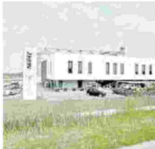
CEREALI L'azienda di Salara